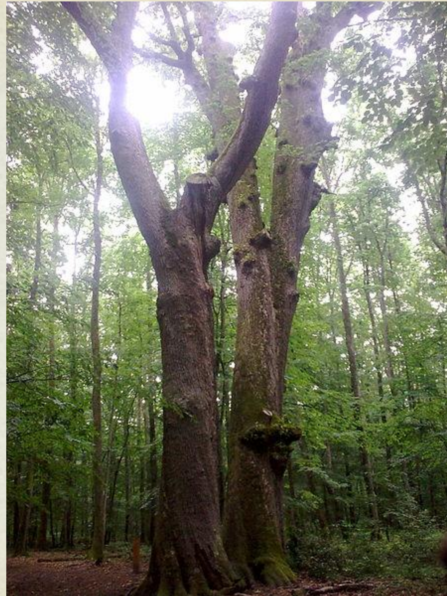
Chênes jumeaux de la forêt de Tronçais dans l'Allier en Auvergne