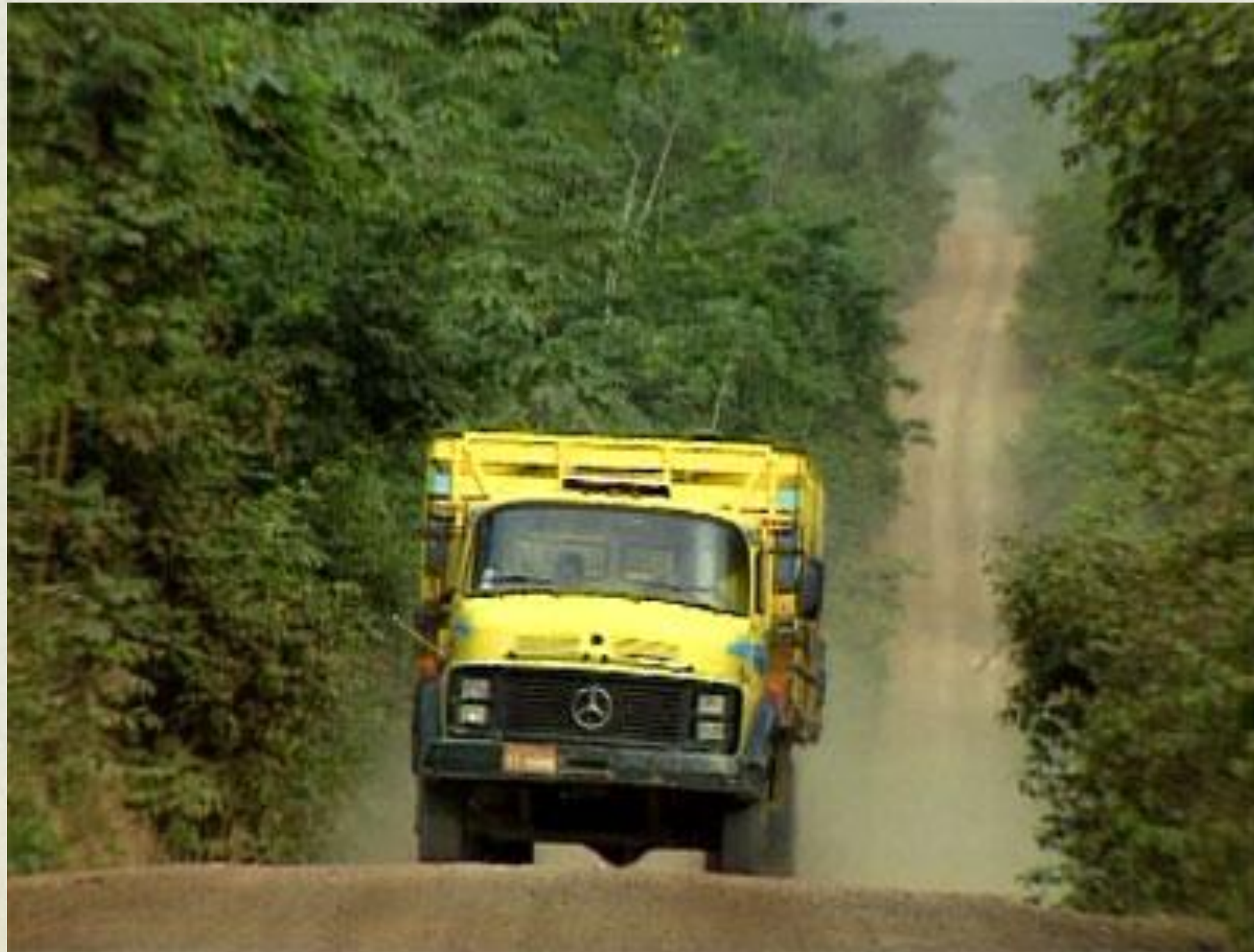
Aménagement de la route transamazonienne au Brésil