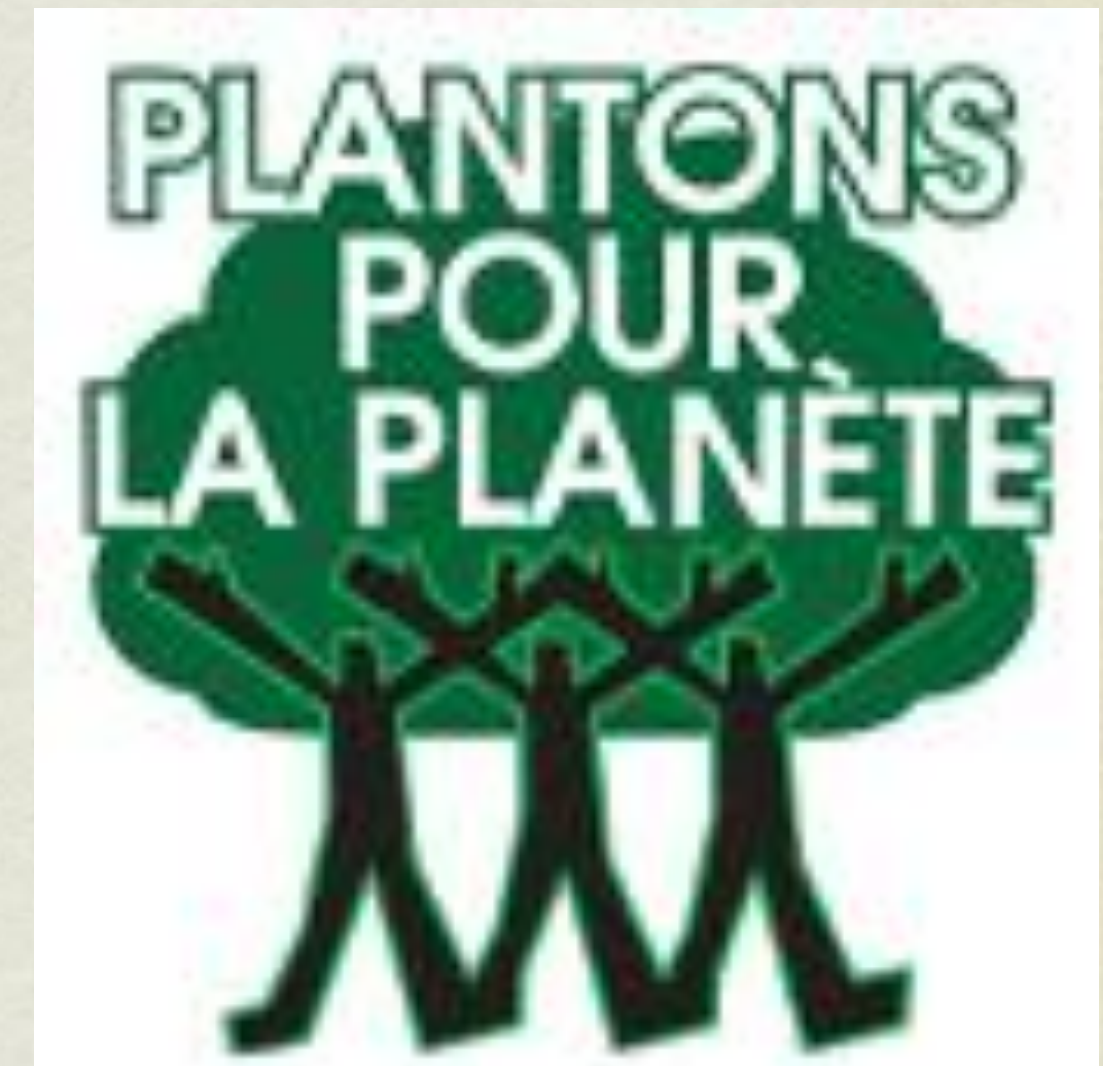
Logo de la « Campagne pour un milliard d'arbres »