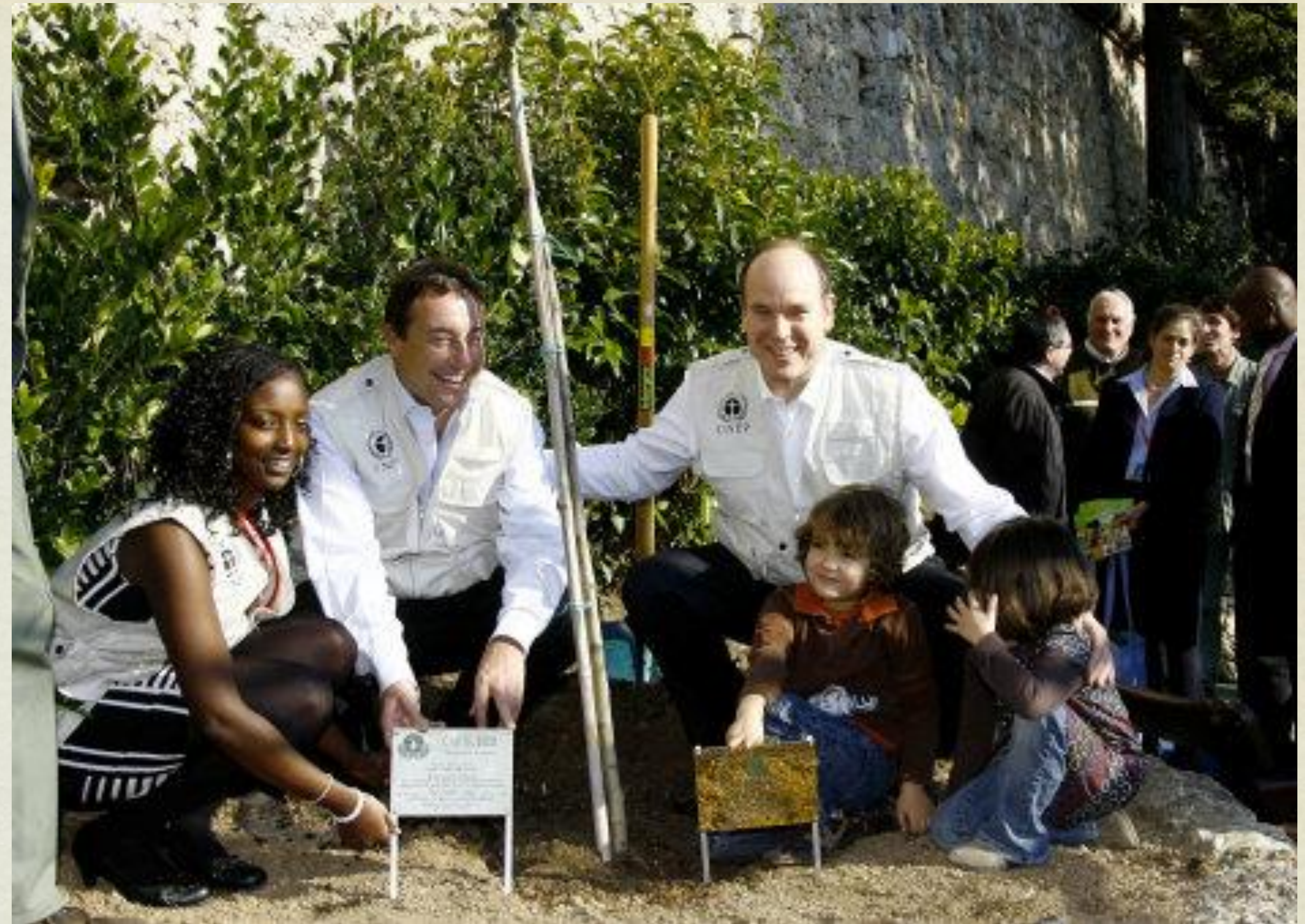
Plantation d'un arbre dans la Principauté de Monaco par le Prince Albert II