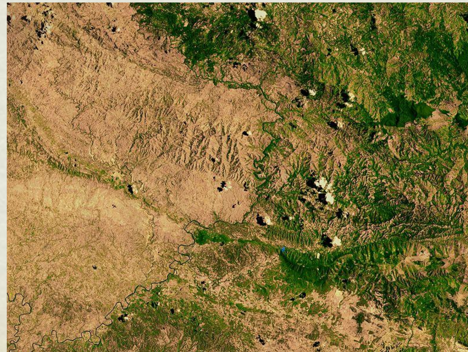
Image satellite de la frontière Haïti (à gauche) / République Dominicaine (à droite) : une déforestation massive en Haïti