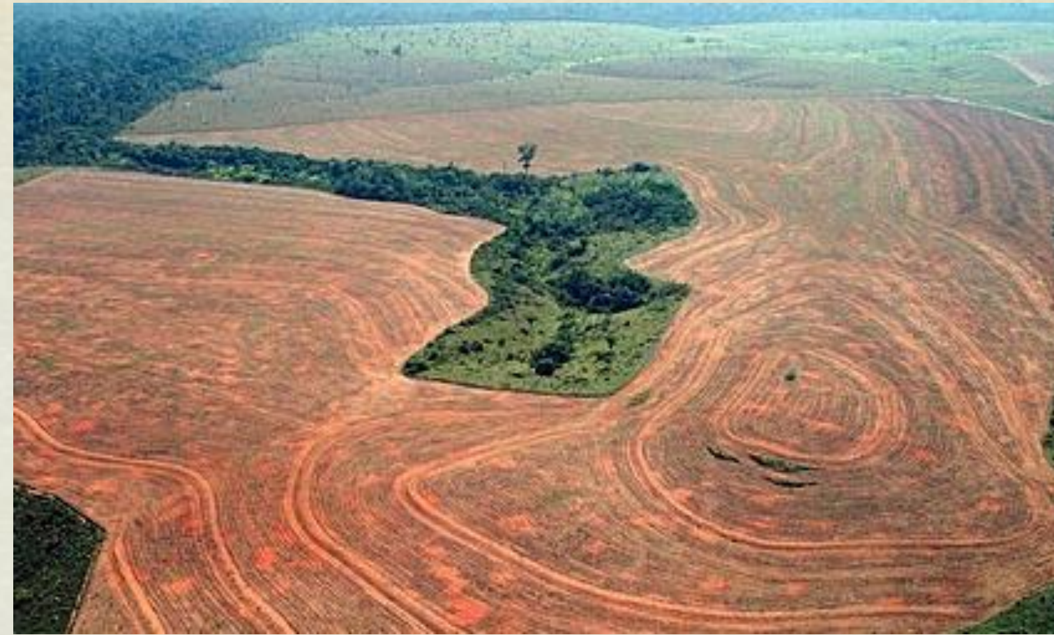
Déforestation en Amazonie pour étendre les cultures de soja