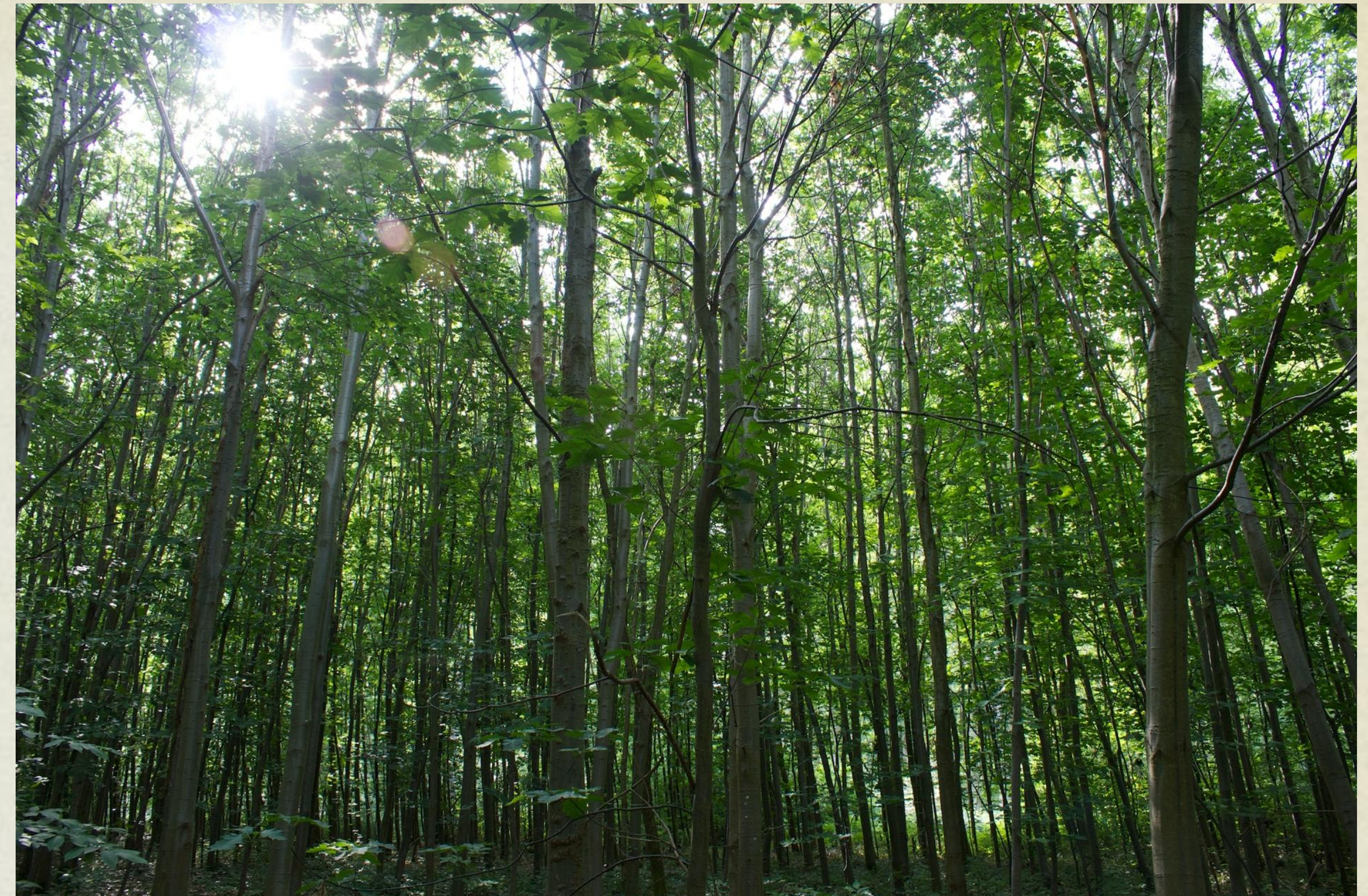
Parcelle de jeunes arbres dans la forêt Verte à Mont Saint-Aignan