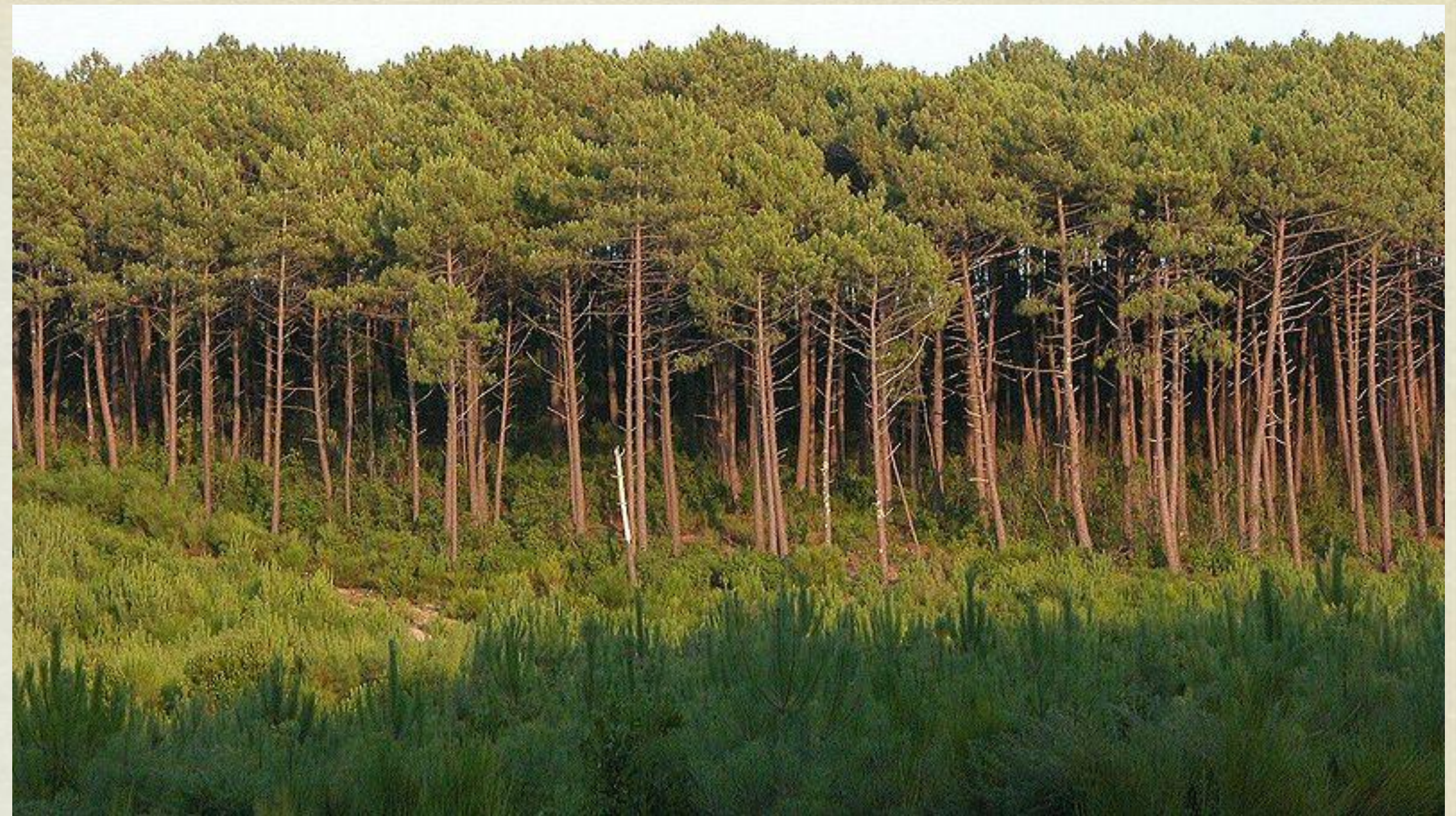
Pins de la forêt des Landes en Aquitaine