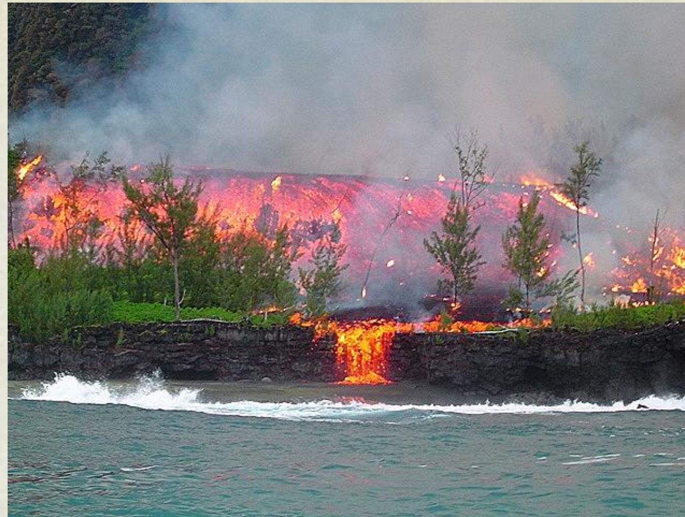
Eruption du Piton de la Fournaise sur l'île de la Réunion en février 2005