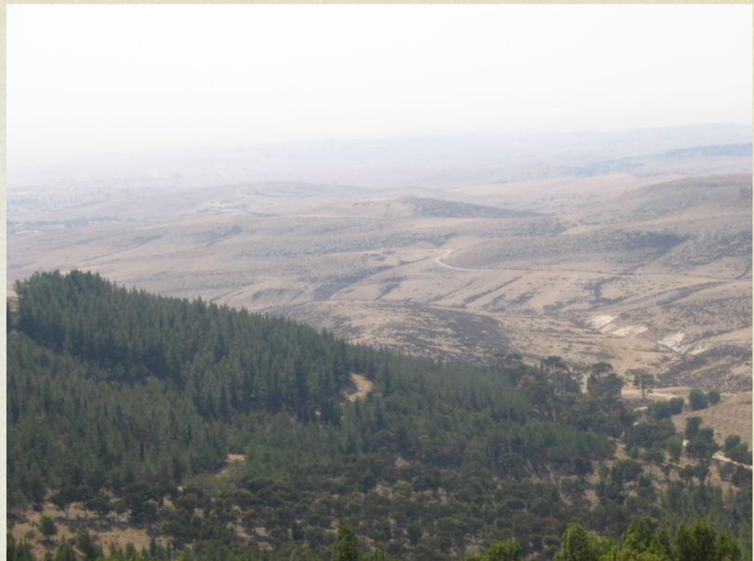
La forêt de Yatir en Israël